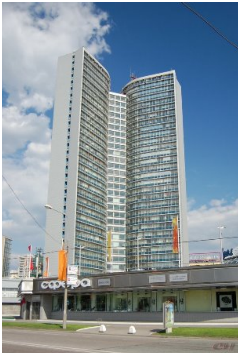
Здание, где проходил съезд

16-17 ноября в здании Мэрии Москвы прошел XI Съезд Всероссийского научно-практического общества эпидемиологов, микробиологов и паразитологов (ВНПОЭМП) «Обеспечение эпидемиологического благополучия: вызовы и решения».